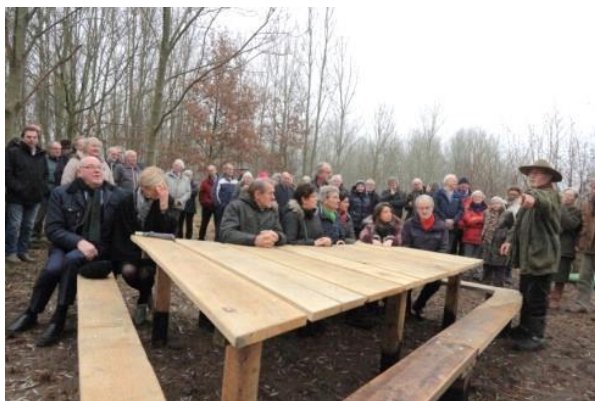
10 december, onthulling van de bank met rechts Driek Termeer, de maker van de bank